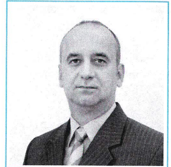
Dr. Vincze István polgármester

Amellett, hogy az önkormányzat ilyen helyzetben volt, a rászorulóok részére kedvezményesen több mint száz mázsa tűzifát osztottunk ki, egy gyermekétkeztetési alapítvánnyal megállapodást kötöttünk és élelmiszer-segélycsomagokat a rászorulóok részére az elmúlt évben is kiosztottuk. Az idén februárban pedig mintegy 15 raklapnyi, több mint 2 millió forint értékű tartós élelmiszert